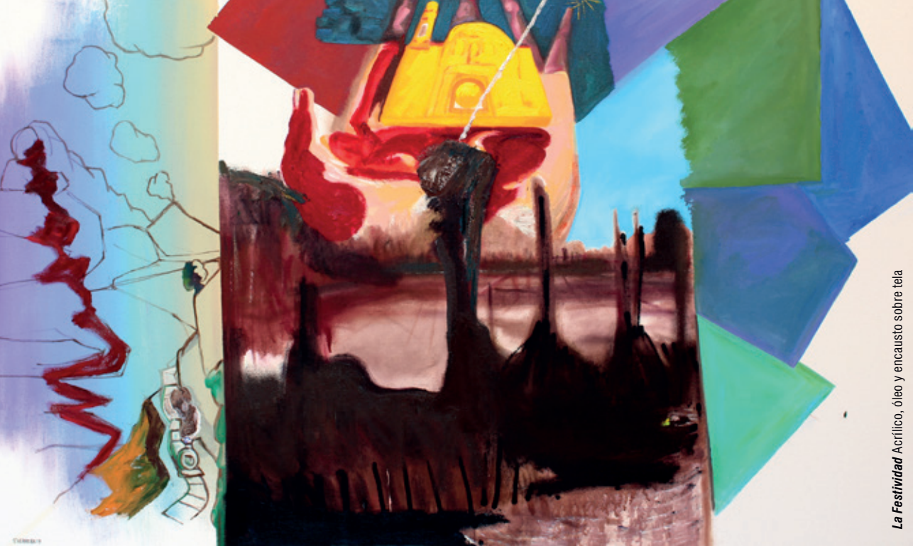
La Festividad Acrílico, óleo y encausto sobre tela