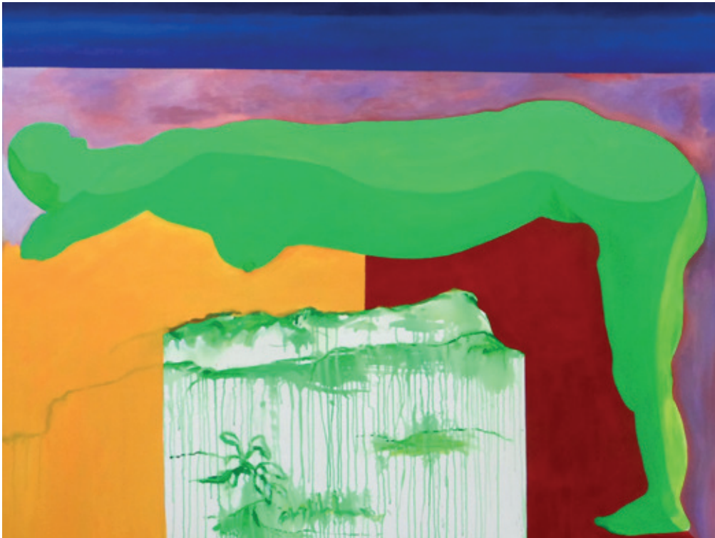
Never de limón Acrílico, óleo y encausto sobre tela