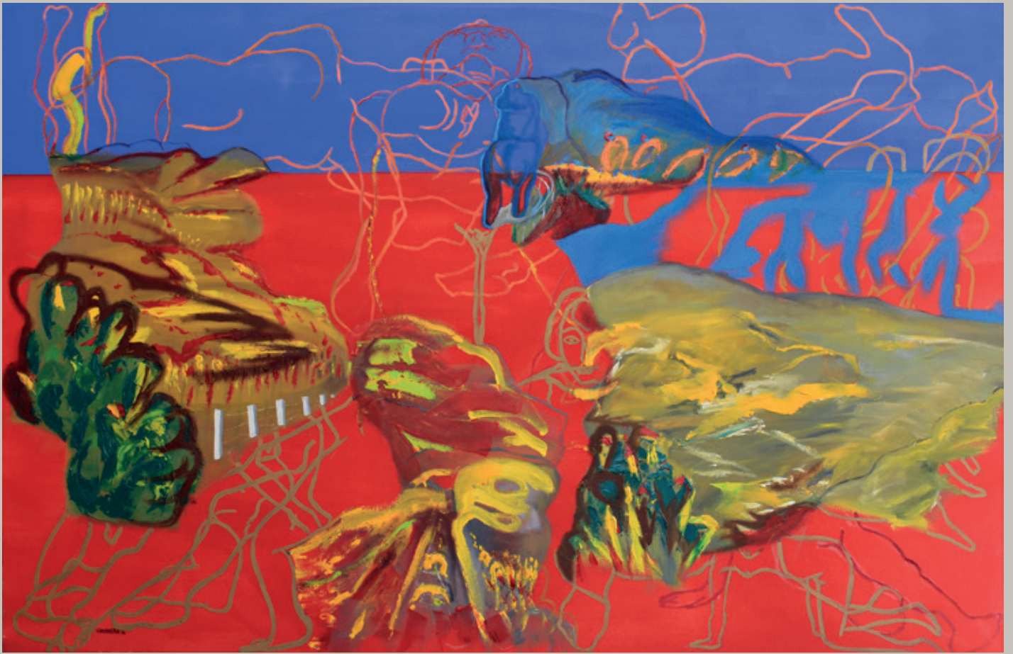
El cielo en la tierra Acrílico, óleo y encausto sobre tela