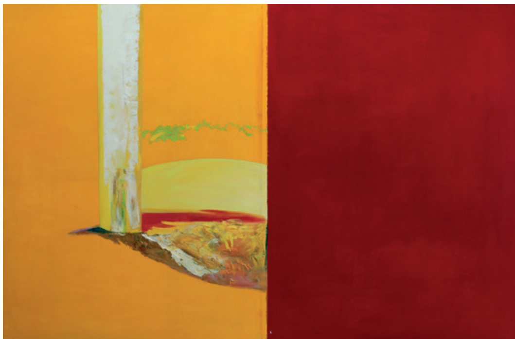
La fiesta Acrílico, óleo y encausto sobre tela