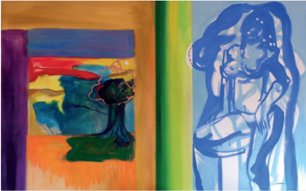
El privado Acrílico, óleo y encausto sobre tela